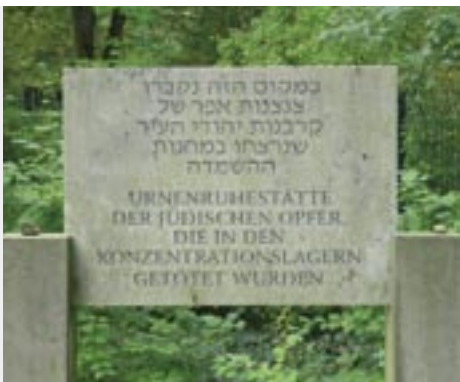
Gedenktafel auf dem Jüdischen Friedhof Halle