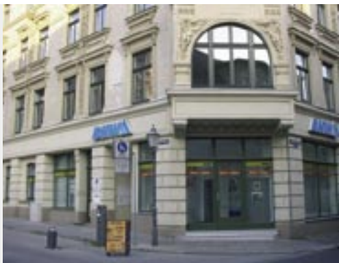
Ehem. Speisehaus Meyerstein, Sternstraße 14